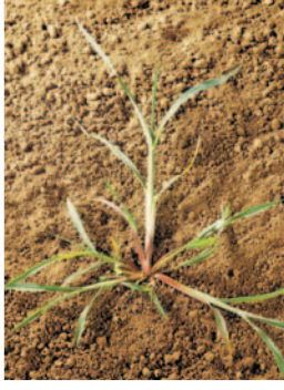
Darıcan ( E. cruss-galli )