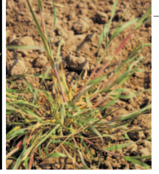
Çatalotu ( D. sanguinalis )

ETKİLİ MADDE : Litrede 50 gr/lt tepraloxym.