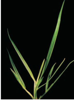
Delice ( L. temulentum )