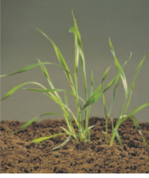
Yabani yulaf ( Avena sp. )