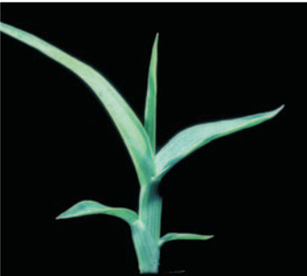
Kanlı çayır ( P. paradoxa ),