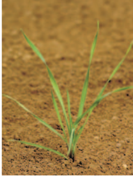
Tilki kuyruğu ( A. myosuroides )