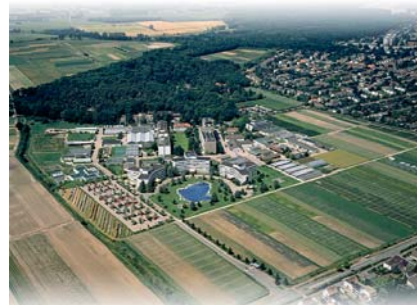
BASF Agro Genel Merkez Limburgerhof-ALMANYA

İstanbul Ofis Defdar Yokuşu No: 3 Tophane 34425 İSTANBUL Tel : (0212) 334 34 00 Faks : (0212) 334 34 99