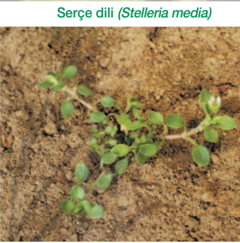
Serçe dili ( Stelleria media )