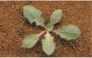
Adi dişotu ( Taraxacum officinalis )

ETKEN MADDE : 244 gr/lit Chloridazon + 150 gr Triallate FORMÜLASYON ŞEKLİ : SE (Süspo-emülsiyon)