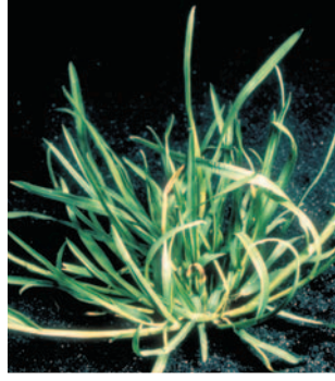
Salkım otu ( Poa sp. )