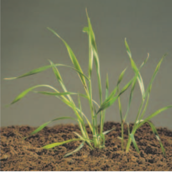
Yabani yulaf ( Avena sp. )