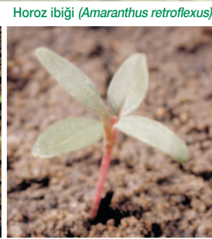
Horoz ibiği ( Amaranthus retroflexus )