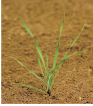
Tilki kuyruğu ( Alopecurus myosuroides )