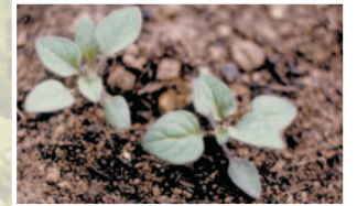
Köpek üzümü ( Solanum nigrum )