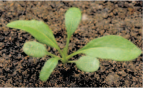
Çoban çantası ( Capsella bursa-pastoris )