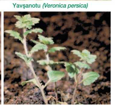
Yavşanotu ( Veronica persica )

Pancarda ekimden önce kullanılmalı ve hemen toprağa karıştırılmalıdır.