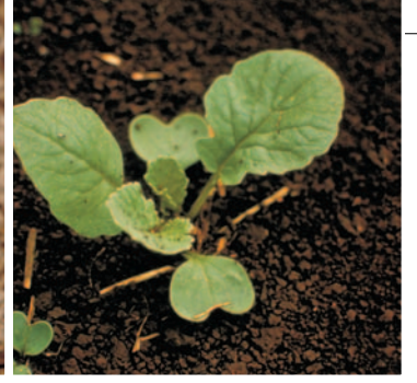
Yabani turp ( Raphanus raphanistrum )