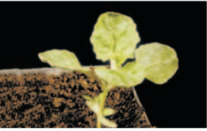
Kara pazı ( Atriplex sp. )