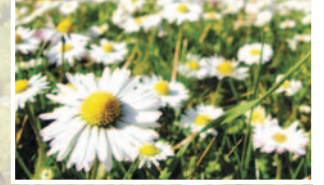
Papatya ( Matricaria sp. )