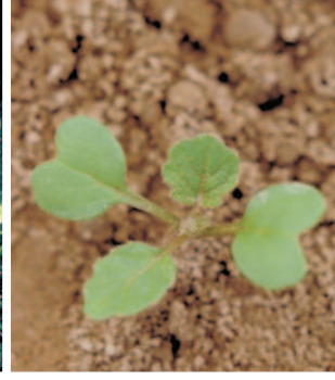
Yabani hardal ( Sinapis arvensis )