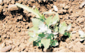
Sirken ( Chenopodium album )