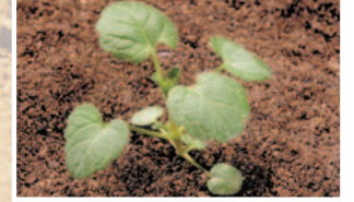
Ballıbaba ( Lamium amplexicaule )