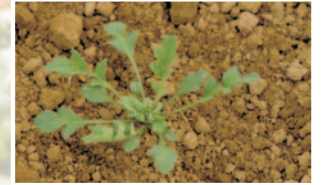
Gelincik ( Papaver rhoeas )