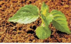
Düğmeotu ( Poterium minor )