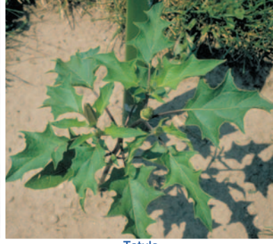
Tatula ( Datura stramonium )