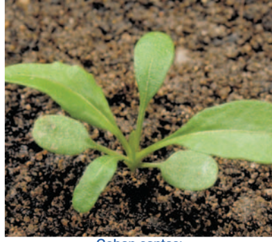
Çoban çantası ( Capsella bursa-pastoris )