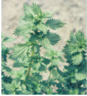
Isırgan otu ( Urtica urens )