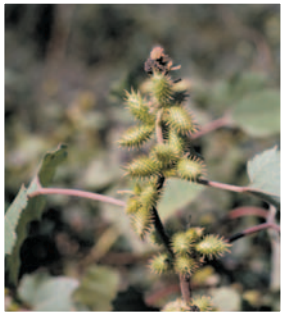
Domuz pıtrağı ( Xanthium strumarium )

ETKİLİ MADDE : 40 gr/lit Imazamox FORMÜLASYON ŞEKLİ : SL (Suda Çözünen Konsantre)