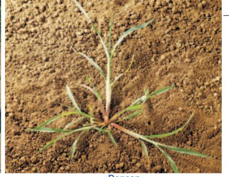
Darıcan ( Echinochloa crus-galli )