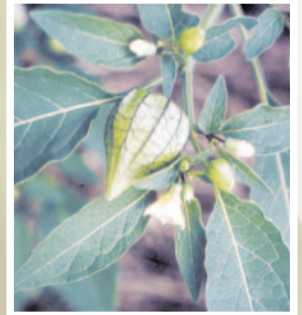
Fener otu ( Physalis angulata )