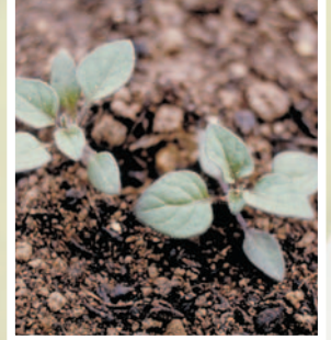
Köpek üzümü ( Solanum nigrum )