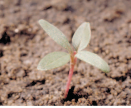
Horoz ibiği ( Amaranthus retroflexus )