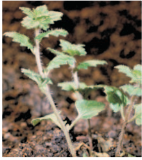
Yavşanotu ( Veronica persica )